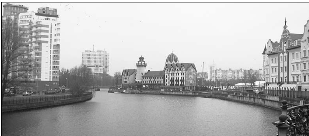
Замочки на мосту в центре Калининграда – символ единения влюбленных, а подлинная любовь соединяет людей независимо от национальности

ляющая утекает сквозь пальцы, растворяется в многоцветии форм.