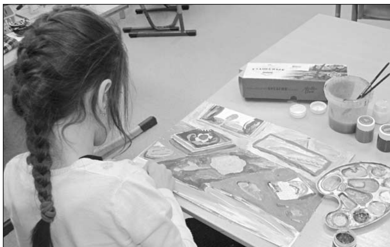
◀ На уроках ИЗО в Православной гимназии