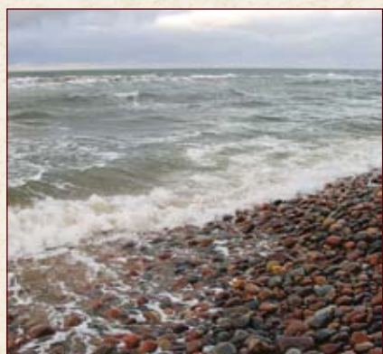
Кто раскрасил камешки