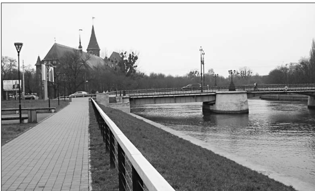
Калининград. Вид на кафедральный собор

привел научные судьбы Эйнштейна и Планка, показав, что «...ученый может совершать величайшие открытия в весьма скромных условиях, но только если по-настоящему живет своим исследованием и имеет достаточно свободы, особенно свободного времени для бескорыстного научного поиска» 4 .