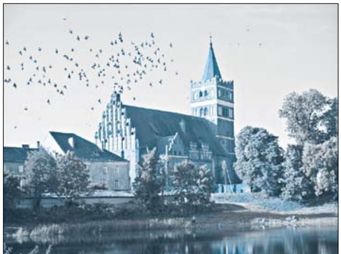
Кирха Св. Георгия в г. Правдинске (ныне церковь св. Георгия Победоносца) (Калининградская область)