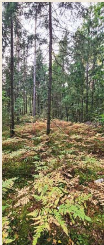
Из древних эр