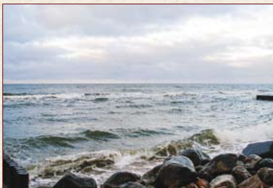
Волны и камни встречаются здесь