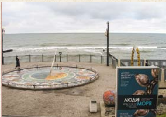
Здесь встретились время и вечность