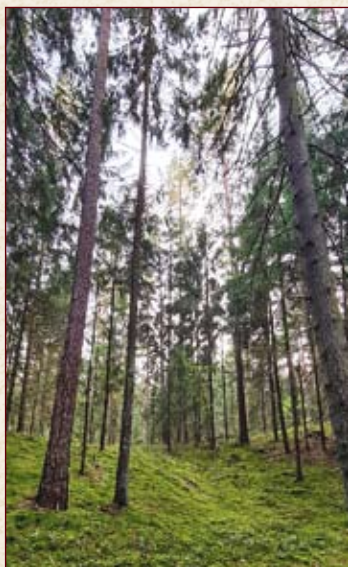
Всюду, всегда есть просвет