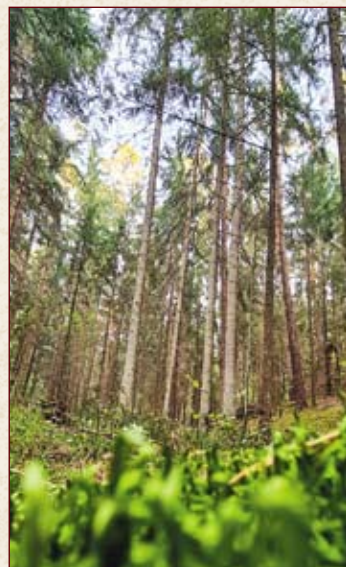
И высоты, и низины