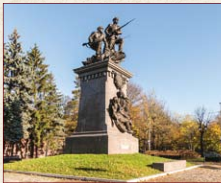
Памятник Героям Первой мировой войны (г. Калининград)