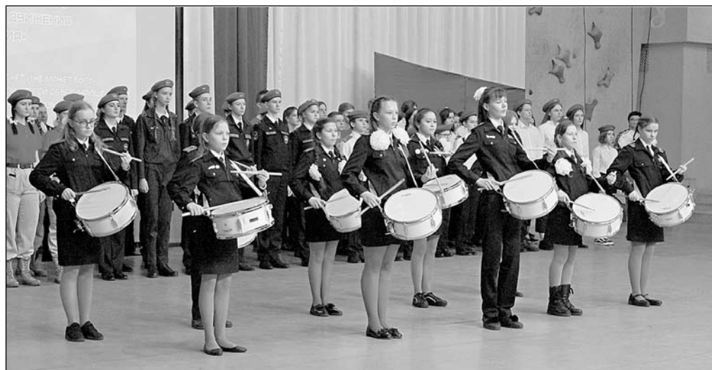
Торжественный прием в юнармейцы в г. Калининграде