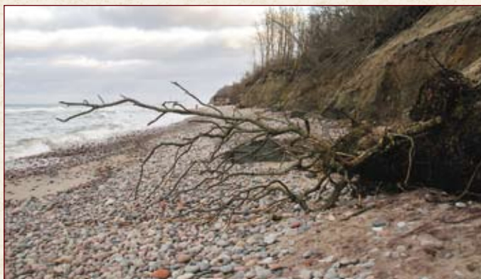
Будто чудище морское