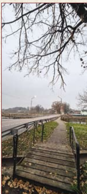
Ветка над мостиком