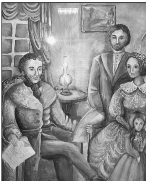
▲ «Семья Пушкина» (из рисунков воспитанников)

выдерживает (не приемлет) новых, не бывалых здесь ранее требований, возрастающей рутины, без которой не обойтись, усиления внутришкольного контроля. И того, что батюшка, такой когда-то хороший, очень добрый и доступный, становится (или пытается стать... или, по крайней мере, делает вид, что пытается стать) директором.