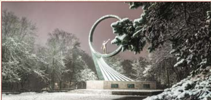
Монумент «Покорителям ближней Вселенной» (г. Калининград)