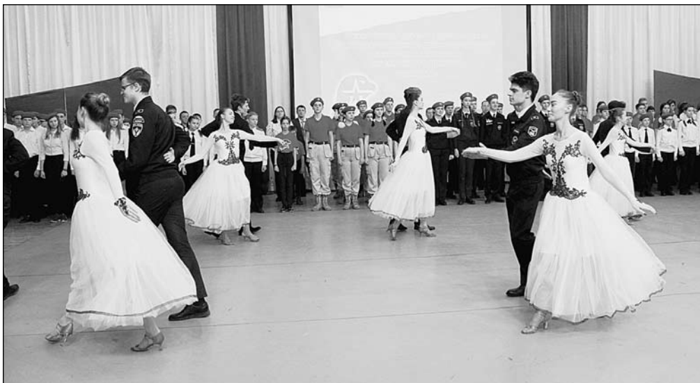
Торжественный прием в юнармейцы в г. Калининграде