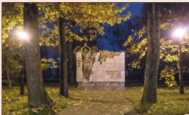
Памятник «Ликвидаторам последствий атомных катастроф» (г. Калининград)