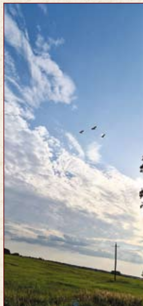
Благословляющие землю (лебеди)