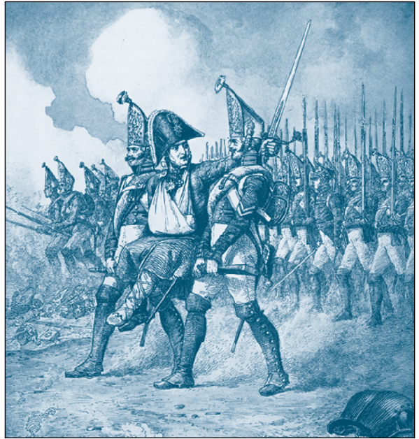
Командир полка генерал Мазовский тяжело раненый воодушевляет полк в сражении под Фридландом 2 июля 1807 г. С гравюры Адольфа Шарлеманя

Мария Белова, учащаяся 10 «В» класса, МАОУ лицей № 49, г. Калининград