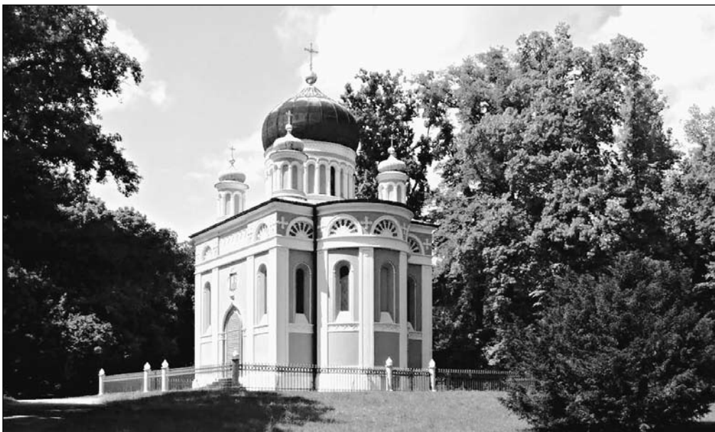
Храм Александра Невского, Потсдам, Германия

сии и Пруссии воплотился в работе «Александровка и храм-памятник святого благоверного князя Александра Невского г. Потсдама (Германия) – «живые» свидетели дружеских взаимоотношений России и Пруссии». Внимание юных исследователей привлек храм-памятник в честь святого князя Александра Невского в русской колонии «Александровка» (г. Потсдам, Германия).