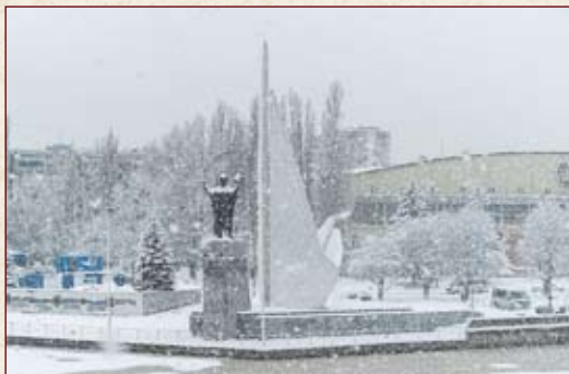
Космос водной стихии (монумент «Пионерам океанского лова», г. Калининград)