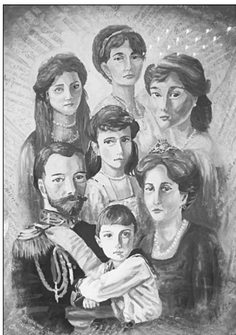
◀ «Царская семья» (из рисунков воспитанников)