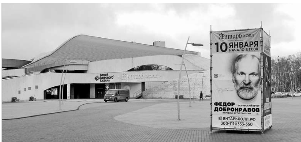
Молодым актерам из «Театра на Зеленой улице» вполне по силам подняться на высокие подмостки и играть вместе о знаменитыми актерами (Январь-холл в г. Светлогорске)

В том же учебном году была апробирована такая форма, как чтение пьесы с последующим обсуждением. Читали современную пьесу Д. Данилова «Сережа очень тупой». Пьеса неоднозначная, брать ее для чтения было большим риском. Во-первых, у автора присутствует ненормативная лексика (я ее, конечно же, исключила из текста), однако сленг и некоторые грубые слова остались. Понятно, что