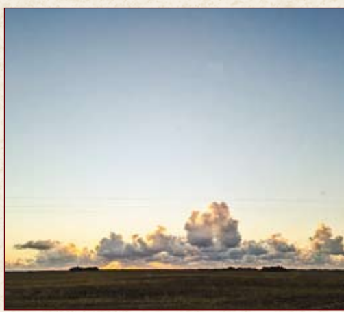
У облаков свой язык